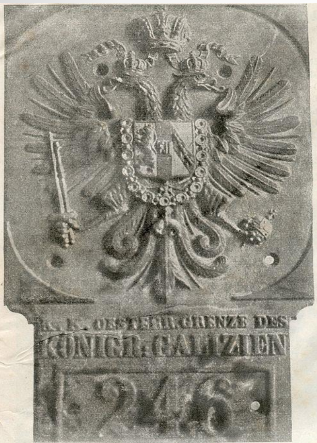
Чугунная доска съ австрійскимъ гербомъ, находящаяся на пограничномъ столбѣ и сорванная нашими войсками при вступленіи въ Галицію. Эта реликвія былого австрійскаго владычества въ Прикарпатской Руси доставлена въ Петроградъ, гдѣ будетъ помещена въ одной изъ военныхъ музеевъ.

Австрийский герб - русский трофей 1914 г.