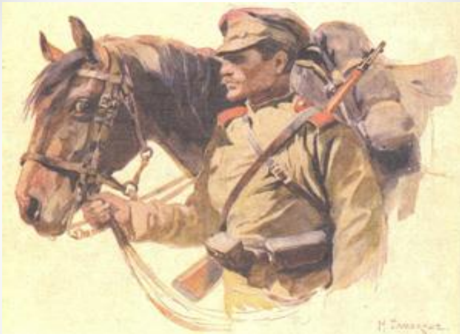
«В Галиции. Кавалерист» Н.С. Самокиш