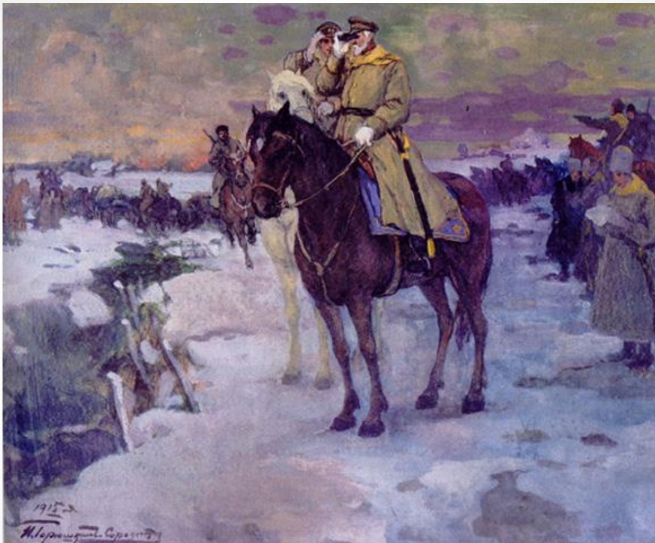
«На позициях 1-ой мировой войны.» Горюшкин-Сорокопудов