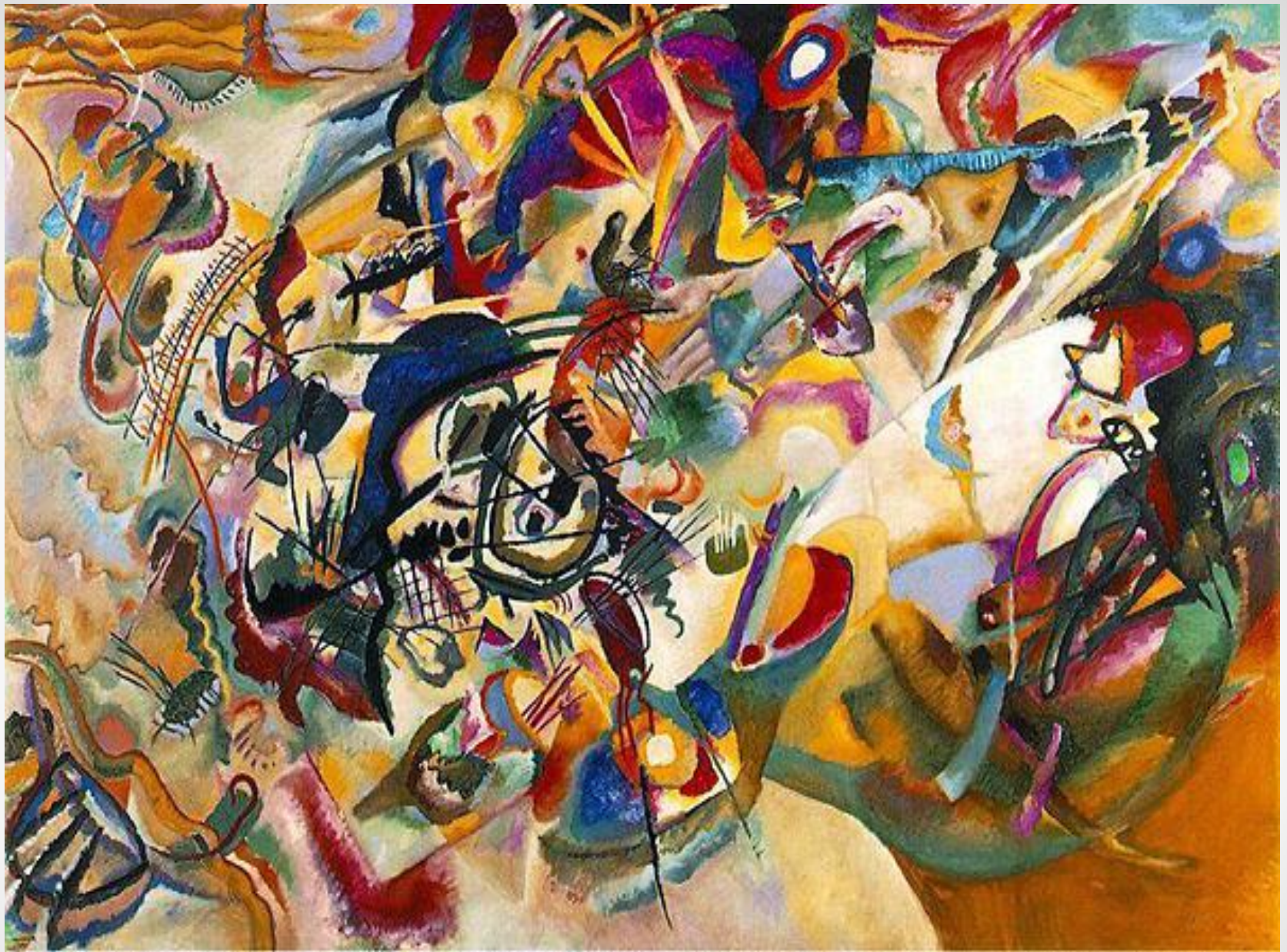
"Первая мировая Война" В. КАНДИНСКИЙ.