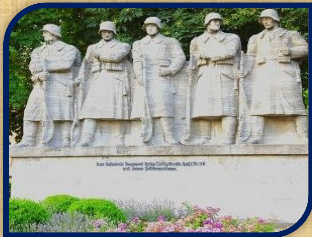
Памятник в Германии