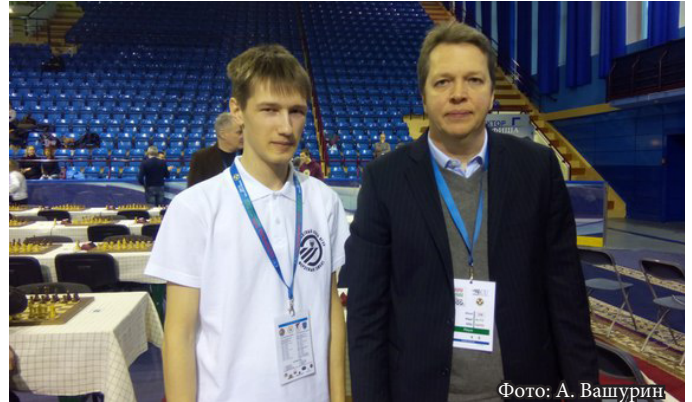
Иван Белоусов с английским гроссмейстером, претендентом на первенство мира Найджелом Дэвидом Шортом

Конечно, я проиграл, но это был бесценный опыт. По блицу я занял 225 место, а по рапиду 458. Мотивация, конечно, появилась, как и бывает после таких крупных мероприятий.