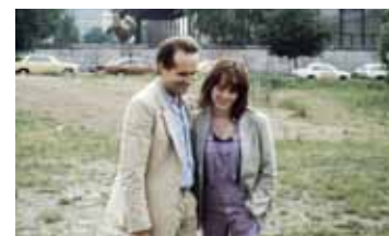
БЕРЛИН, ШАМИССОПЛАТЦ ГЕРМАНИЯ, ФРГ / 1980 / 112 МИН. / 16+

В октябрьскую ночь 1978-го в тюрьме «Штаммхайм» при загадочных обстоятельствах погибают три члена террористической группировки RAF, в том числе Гудрун Энслин. Официально объявленная самоубийством, их смерть вызывает сомнения у общества. Знаменитый фильм Маргарет фон Тротта, давший имя всем европейским семидесятым, рассказывает реальную историю сестры Гудрун Кристианы, которая пыталась доказать, что та была убита государством.