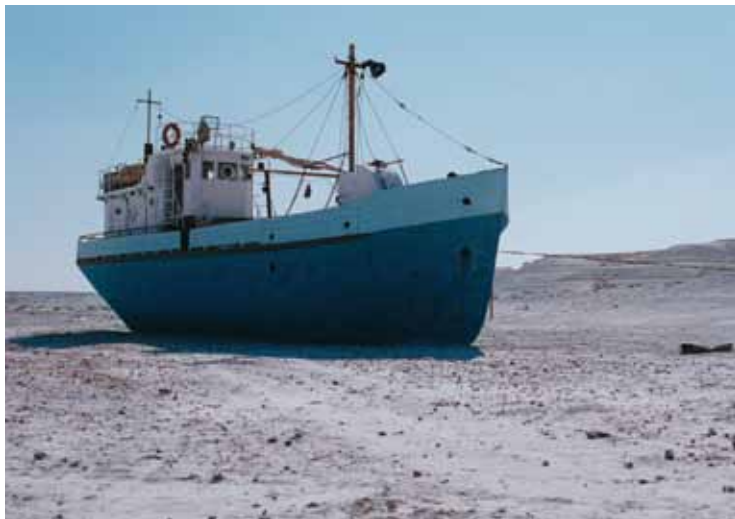
11 ИЮНЯ / 18:30 / ИВАНОВО, «ЛОДЗЬ» СПЕЦПОКАЗ ПАМЯТИ РЕЖИССЕРА БАХТИЁРА ХУДОЙНАЗАРОВА ПРЕДСТАВЛЯЕТ ЕГОР БЕРОВ

РОССИЯ — ГЕРМАНИЯ — ФРАНЦИЯ — БЕЛЬГИЯ — КАЗАХСТАН — УКРАИНА / 2013 / 109 МИН. / 12+