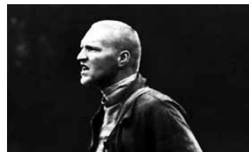
СТАЛКЕР СССР / 1979 / 163 МИН. / 12+

Режиссер: Константин Худяков. Сценарий: Константин Худяков, Дина Рубина. Оператор: Дильшат Фатхулин. Художник: Валерий Филиппов. Музыка: Алексей Шелыгин. В ролях: Алиса Фрейдлих, Евгений Миронов, Алена Бабенко, Евгений Князев. Продюсер: Владилен Арсеньев. Производство: «Президент-фильм».