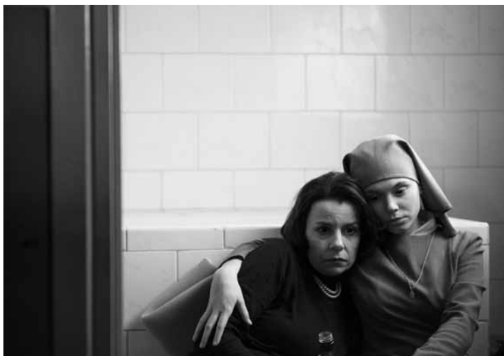
14 ИЮНЯ / 17:00 / ИВАНОВО, МУЗЫКАЛЬНЫЙ ТЕАТР

ПОЛЬША — ДАНИЯ — ФРАНЦИЯ — ВЕЛИКОБРИТАНИЯ / 2013 / 80 МИН. / 18+