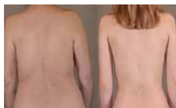
НЕВОЗМОЖНОСТЬ КОНТРОЛЯ РОССИЯ / 2015 / 1 МИН. / 18+

Пару лет назад я выпил половину кружки кофе и понял, как это должно быть: деньги на ветер. Я загодя съездил в Сочи, чтобы посмотреть там место для проекта, но понял, что в этом нет необходимости. Заснеженное поле кажется мне идеальным пространством — оно чистое, и оно очень русское. Не уверен насчет русской идеи, но русское место для своих идей я точно нашел. Интересно, что визуально эта нейтральность близка к стерильным пространствам галерей и музеев. Но генетически они различны: поле не стерильно, оно наполнено ветрами, светом и мифами.