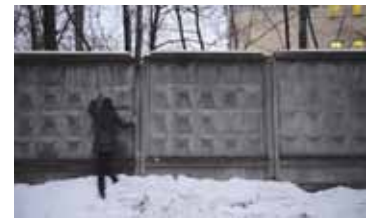
ART РОССИЯ / 2015 / 4 МИН. / 12+

Видео состоит из десяти сцен, воспроизводящих персонажей живописи художника Бальтуса. Персонажи, застывшие в атмосфере бездеятельности, актуализируют зависшее как бы в транс сознание современного человека, посетителя соцсетей, имиджбордов, форумов, где информация представлена в фрагментированном виде.