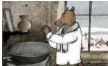
ВОЛК ВАСЯ РОССИЯ / 2014 / 17 МИН. / РИСОВАННЫЙ

История об Андрее Хижине, его жене Вареньке, дяде Кузьме Кузьмиче и одном непрошеном госте. Действие фильма разворачивается в 30-х годах прошлого века.