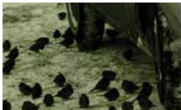
БЕЛЫЙ ГОРОД СССР / 1988 / 37 МИН. / 16+