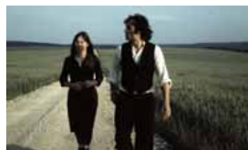
Я ТЕБЯ ЛЮБЛЮ, Я ТЕБЯ УБЬЮ ГЕРМАНИЯ, ФРГ / 1971 / 94 МИН. / 18+

Начало 1950-х. Полузабытая звезда довоенного кино смотрит свой старый фильм. За ней — еще один зритель, одутловатый и небритый (сам Фассбиндер). Не досмотрев, она выходит в осенний парк, где хлещет дождь и смешивается с ее слезами. Прохожий попытается спасти ее от того, от чего спасти невозможно. Великий и горький фильм Фассбиндера — взгляд на историю ФРГ 1950-х и предсмертная записка режиссера.