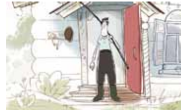
ЧУДИК РОССИЯ / 2014 / 7 МИН. / 12+ / РИСОВАННЫЙ, КОМПЬЮТЕРНАЯ ПЕРЕКЛАДКА

Фильм о приключениях Ренара-лиса — отчаянного смельчака, нахала и пройдохи.