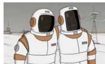
МЫ НЕ МОЖЕМ ЖИТЬ БЕЗ КОСМОСА РОССИЯ / 2014 / 15 МИН. / 6+ / РИСОВАННЫЙ

Фильм из серии «Гора самоцветов». Кота выгнали. А Лиса подобрала. И зверей пугала.