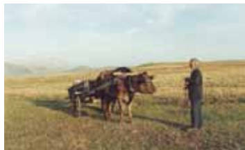
ВОЗВРАЩЕНИЕ ПОЭТА АРМЕНИЯ / 2005 / 88 МИН. / 16+