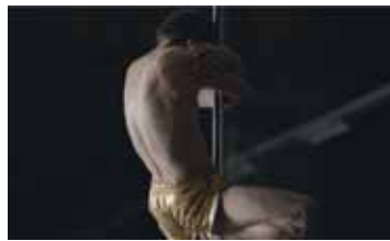
ПАРАДНЫЙ ПОРТРЕТ РОССИЯ / 2014 / 8 МИН. / 16+

Если у вас не стопроцентное зрение и вы носите очки либо контактные линзы, необходимо регулярно проверять остроту зрения. Зрение подвержено ухудшению, особенно у тех, кто регулярно смотрит телевизор и много работает за компьютером. Видеопроверка зрения по таблице Сивцева поможет комфортно и легко следить за собственным зрением, а в случае его ухудшения вы сможете вовремя обратиться к специалисту за дополнительной консультацией.