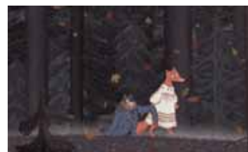
КОТ И ЛИСА РОССИЯ / 2004 / 13 МИН. / РИСОВАННЫЙ

Самая обычная история любви, происходящая в самом непригодном для этого месте.