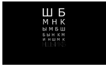
ПРОВЕРКА ЗРЕНИЯ РОССИЯ / 2014 / 1 МИН. / 0+

ВТОРОЙ ПОКАЗ ПРОГРАММЫ «ВИД ИЗ ДРУГОГО ОКНА: ВИДЕОАРТ» СОСТОИТСЯ 11 ИЮНЯ В 20:00 В КИНОЦЕНТРЕ «ЛОДЗЬ», ИВАНОВО