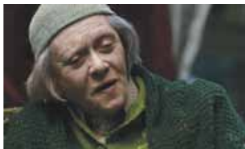
НА ВЕРХНЕЙ МАСЛОВКЕ РОССИЯ / 2004 / 115 МИН. / 12+