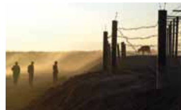
ГРАНИЦА АРМЕНИЯ — НИДЕРЛАНДЫ / 2009 / 82 МИН. / 16+