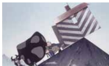
НА КРАЮ ЗЕМЛИ РОССИЯ — ФРАНЦИЯ / 1998 / 8 МИН. / РИСОВАННЫЙ

Смешная история о капризном ребенке и его маме.