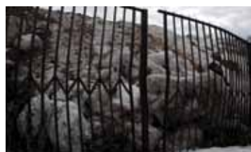
ГОРА РОССИЯ / 2015 / 2 МИН. / 0+

ПЕРВЫЙ ПОКАЗ ПРОГРАММЫ «ВИД ИЗ ДРУГОГО ОКНА: ВИДЕОАРТ» СОСТОИТСЯ 10 ИЮНЯ В 19:00 В КИНОЦЕНТРЕ «ЛОДЗЬ», ИВАНОВО