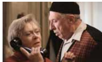
ПОЛТОРЫ КОМНАТЫ, ИЛИ СЕНТИМЕНТАЛЬНОЕ ПУТЕШЕСТВИЕ НА РОДИНУ РОССИЯ / 2008 / 130 МИН. / 16+