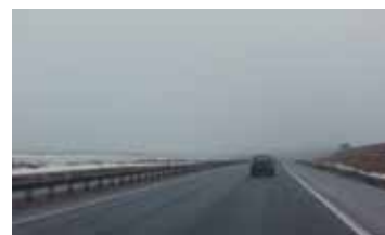
ДЛИННОЕ. ЧЕРНОЕ. ОБЛАКО ПУСКАЕТСЯ РОССИЯ / 2014 / 57 МИН. / 16+

11 ИЮНЯ / 13:00 / ПЛЁС, ЛЕВИТАН-ХОЛЛ, ЗАЛ №2 12 ИЮНЯ / 18:00 / ИВАНОВО, «ЛОДЗЬ»