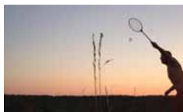
БЫЛИНКА РОССИЯ / 2014 / 7 МИН. / 0+

Поиск смысла действия часто поглощает больше времени, чем само действие, и рефлексия парализует активную деятельность. Стоит ли начинать то, что не будет завершено? Где можно поставить точку, и возможно ли то? Эти вопросы приобретают гипертрофированную важность в ходе поисков художественного смысла в работе. Художнику необходимо умение отбрасывать сомнения и делать то, что представляется необходимым здесь и сейчас.