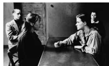
СВИНЦОВЫЕ ВРЕМЕНА ГЕРМАНИЯ, ФРГ / 1981 / 106 МИН. / 16+

Начало 1930-х. В тюрингской деревне живут мать и дочь, у которых своя маленькая религия: они верят в здоровый труд, не едят мяса и не признают частную собственность. Как-то сероватым днем к дому прибывает молодой поляк, товарищ по вере. Так незаметно приходит в маленькую семью распад, который охватит всю страну в день, когда Германия проголосует за Гитлера.