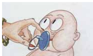
ПУСТЫШКА РОССИЯ / 1994 / 1 МИН. / РИСОВАННЫЙ

ПЕРВЫЙ ПОКАЗ ПРОГРАММЫ СОСТОИТСЯ 10 ИЮНЯ В 16:00 В КИНОЦЕНТРЕ «ЛОДЗЬ», ИВАНОВО ВТОРОЙ ПОКАЗ СОСТОИТСЯ 11 ИЮНЯ В 13:45 В КИНОЗАЛЕ «ЛЕВИТАН-ХОЛЛ», ПЛЁС