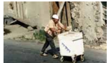
КОНД СССР / 1987 / 40 МИН. / 16+

Сценарий: Арутюн Хачатрян, Микаэл Стамболцян. Оператор: Армен Миракян. Музыка: Эмма Мигранян. Производство: Hayfilm , «Арменфильм».