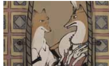
РОМАН О ЛИСЕ РОССИЯ / 2014 / 15 МИН. / РИСОВАННЫЙ

Пять новелл о любви, придающей жизни истинный смысл. В основе двух из них лежат рассказы «Машина и парашют» Игоря Хилова и «Кто что несет» Юрия Роста.