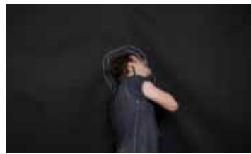
ВЕНЕЦ РОССИЯ / 2015 / 4 МИН. / 12+

Бесконечность ожидания: мы слышим рокот мотора, шест подготовлен, фигуры послушно складываются в флаг — эта бесконечная репетиция обречена так и остаться в вечности, не став моментом истории. Ритуал поднятия флага, призванный продемонстрировать силу в срежисированной бесконечности, лишь обнажает бессилие производимого действия: флаг поднимается на закрытой территории, его торжественное возведение становится метафорой победы, которой никогда не будет.