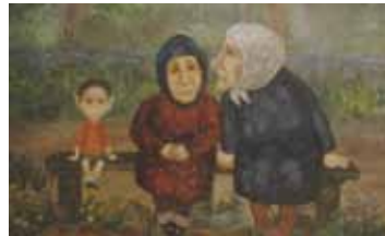
ОБЛАКА РУЧНОЙ РАБОТЫ РОССИЯ / 2014 / 27 МИН. / КОМПЬЮТЕРНАЯ ПЕРЕКЛАДКА

Волк Вася, молодой художник, приезжает в провинциальный городок, чтобы создать шедевр, который принесет ему мировую известность. Но весна меняет его планы, да и сияющая вершина славы оказывается не так близка, как казалось.