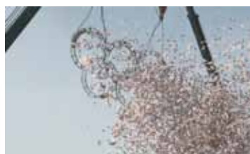
FIGURE #2: GAME РОССИЯ / 2014 / 1 МИН. / 0+

Былинка — стебель травы, обычно высохший, пожелтевший, некто очень худой, слабый (переносное). Уменьшительное к словам «былина», «быль».