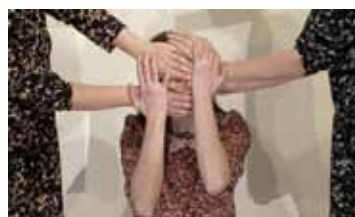
УТРАЧЕННЫЕ ФРАГМЕНТЫ РОССИЯ / 2014 / 5 МИН. / 12+

Работа посвящена преодолению внешнего и внутреннего пространства. Это попытка совместить физическое тело объекта с искусственным ландшафтом: его циклическое движение как стадия для совершения выбора или невозможность его сделать.