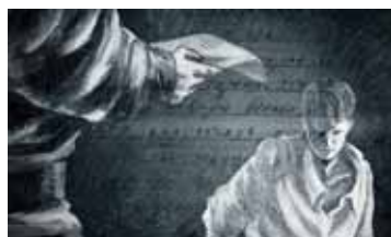
ВОЛШЕБНЫЙ КОМСОМОЛЕЦ РОССИЯ / 2014 / 60 МИН. / 16+

12 ИЮНЯ / 15:00 / ПЛЁС, ЛЕВИТАН-ХОЛЛ, ЗАЛ №2 12 ИЮНЯ / 20:00 / ИВАНОВО, «ЛОДЗЬ»