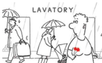
УБОРНАЯ ИСТОРИЯ — ЛЮБОВНАЯ ИСТОРИЯ РОССИЯ / 2006 / 9 МИН. / РИСОВАННЫЙ НА КАЛЬКЕ, КОМПЬЮТЕРНАЯ ГРАФИКА

Самая обычная семья живет в самых необычных условиях на вершине горы.