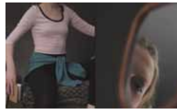
БАЛЬТУС РОССИЯ / 2014 / 13 МИН. / 6+

Художник оставляет свой след в истории посредством произведения искусства. Впечатывая себя в полотно современности, сегодня я передаю часть себя тем, кто увидит эту работу завтра.