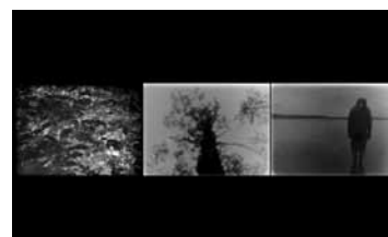
УСКОЛЬЗАЮЩИЙ ГОРИЗОНТ РОССИЯ / 2014 / 11 МИН. / 12+

Тело как метафора. Образ художника как образ любого человека, осознающего возможность быть свободным хотя бы в своем внутреннем мире. Действовать свободно в современном обществе невозможно — это «аморально», больно, разрушительно. Но должен оставаться шанс сохранить внутреннюю свободу от влияния вновь возникающих догм и понятий, проникающих в нас отовсюду.