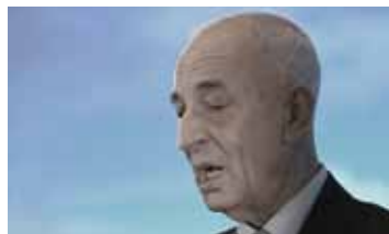
ИНТОНАЦИЯ. ЮРИЙ ШМИДТ РОССИЯ / 2009 / 39 МИН. / 16+

Майскую демонстрацию и салют Сокуров снял как изнанку официального жанра кинохроники, парад народного единства — как усталую массу, распадающуюся без режиссерской руки и без цели. Часть вместо целого, индивидуальные черты всеобщего лица, из деталей вырастающий символ: постулаты монтажного кино, разработанные Эйзенштейном, Сокуров пересматривает в аспекте нового времени.