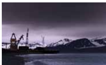
ГРУНАНТ. ОСТРОВ КОММУНИЗМА РОССИЯ / 2014 / 54 МИН. / 16+

11 ИЮНЯ / 15:20 / ПЛЁС, ЛЕВИТАН-ХОЛЛ, ЗАЛ №2 10 ИЮНЯ / 16:30 / ИВАНОВО, «ЛОДЗЬ»