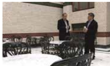
ИНТОНАЦИЯ. СЕРГЕЙ СЛОНИМСКИЙ РОССИЯ / 2009 / 45 МИН. / 16+

Многосерийное интервью с выдающимися общественными деятелями России. Юрий Шmidt (1937–2013) — адвокат и правозащитник, с конца 1980-х годов участвовавший во множестве общественно значимых уголовных процессов.