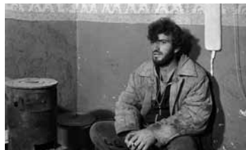
ВОЗВРАЩЕНИЕ НА ЗЕМЛЮ ОБЕДОВАННУЮ АРМЕНИЯ / 1991 / 87 МИН. / 16+