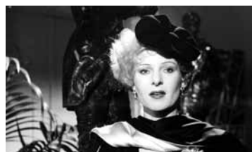
ТОСКА ВЕРОНИКИ ФОСС ГЕРМАНИЯ, ФРГ / 1982 / 104 МИН. / 16+

Режиссер: Райнер Вернер Фассбиндер. Сценарий: Райнер Вернер Фассбиндер, Пеа Фрелих, Петер Мертесхаймер. Художник: Рольф Цеембауэр. Музыка: Пеер Рабен. В ролях: Розель Цех, Хильмар Тате, Аннемари Дюрингер. Продюсер: Томас Шюли. Производство: Bavaria Film.