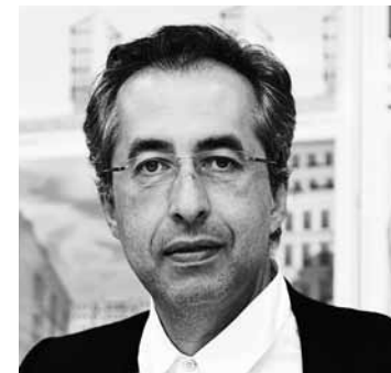
Сергей Чобан Архитектор Россия — Германия

Два молодых москвича работают «в интернете», не очень знают, для чего живут, не очень понимают свою страну и не видят перспектив в жизни. Телевизор прожужжал все уши про зимнюю Олимпиаду-2014 в Сочи, поэтому они берут напрокат машину, покупают билеты и едут через всю страну посмотреть на соревнования, на море и на Россию за МКАДом.