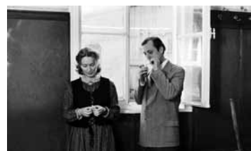
МАТЬ КЛАРЫ ГЕРМАНИЯ, ФРГ / 1978 / 104 МИН. / 16+

Где-то в Германии. Сонная солнечная деревушка, где есть бургомистр, священник, пара полицейских и охотник, который отстреливает волков. Звонят колокола, звенят колокольчики на шеях коров, катаются в пробирках цветные пилюли, которые принимают жители, чтобы удерживать идиллию в равновесии. Тем временем в деревню прибывает новый учитель, в него влюбляется охотник. Галлюцинаторный фильм Уве Бранднера разбирает идею немецкого порядка на составные части.